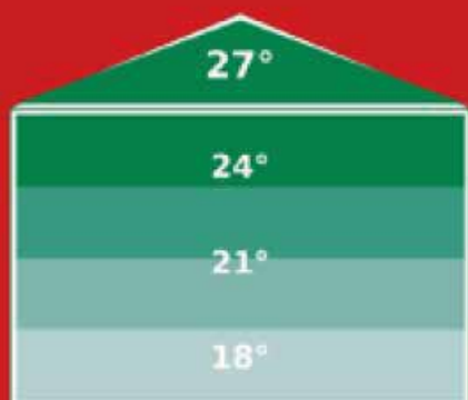
Bâtiment sans déstratificateur