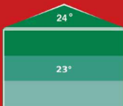
Bâtiment avec déstratificateur